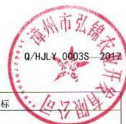
表 2 理化指标